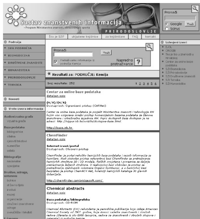
Slika 3 – Prikaz dijela informacijskih izvora iz područja kemije

cijski izvor postoji skraćeni opis s poveznicom na internet, a na raspolaganju je i detaljan zapis sa cjelovitim opisom informacijskog izvora unutar baze podataka.