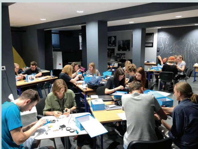
Slika 2 – Rad u skupinama na drugom danu Ljetne škole robotike (rastavljanje i sklapanje mBota)