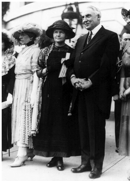
Marie Curie s američkim predsjednikom W. Hardingom (1920.)

Da bi ispravili nepravdu što dvostruka nobelovka nije izabrana za člana Francuske akademije znanosti i umjetnosti, 1922. izabrali su je, bez potrebne procedure, za članicu Medicinske akademije. Godinu dana kasnije u toj akademiji je, u organizaciji Francuske vlade, na svečanosti u povodu 25. obljetnice otkrića radija, predsjednik Francuske dodijelio Marie Curie kao "narodnu zahvalu" mirovinu od 40 000 franaka, koju nasljeđuju njezine kćeri.