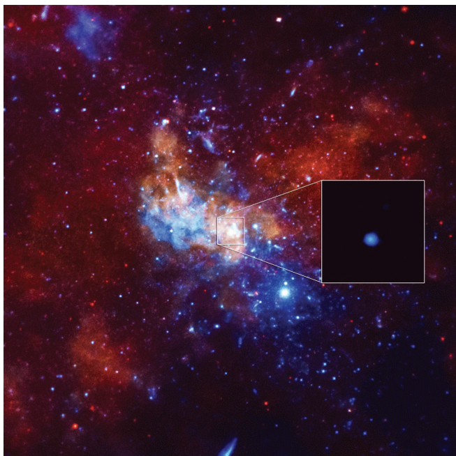
Slika 1 – Supermasivna crna rupa Sgr A* u središtu naše galaksije, unutar zvijezda Strijelac.

rupe u središtu naše galaksije. Odbor za dodjelu Nobelove nagrade oprezno je to sročio: “za otkriće supermasivnog kompaktnog objekta u središtu naše galaksije”. Ali taj kompaktni objekt, prema svim današnjim spoznajama, ne može biti ništa drugo nego ogromna crna rupa. Ogromna u smislu mase (od približno četiri milijuna masa Sunca), a ne u smislu veličine (od približno 100 milijuna kilometara, što je jako jako sićušno u usporedbi s veličinom cijele galaksije).