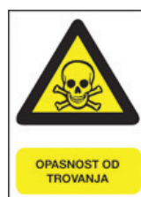
Slika 2a – Znak za opasnost od trovanja