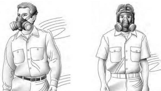
Slika 3 – OZO koji je ovisan o okolnom zraku, polumaska i maska za zaštitu cijelog lica. Ne smije se upotrebljavati u okolišu, gdje postoji nedostatak kisika, tj. manje od 17 % kisika u zraku!

Prva podjela je na opremu koja je ovisna o okolnom zraku i onu koja to nije. Na slikama 3 – 5 dani su primjeri. Zadržat ćemo se na OZO-u koji je ovisan o okolnom zraku. Njime se udiše okolni zrak, a na filtru se zadržavaju štetni spojevi. Filtar u sebi sadrži aktivni ugljen i/ili celulozni papir za zadržavanje čestica u porama. Na slici 6 je prikazana unutrašnjost filtra.