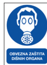
Slika 1 – Znak za obvezatnu upotrebu zaštite dišnih organa

Očekivano je da OZO upotrebljava uvijek jedan radnik, ali kada je OZO namijenjen za izvanredne ili povremene situacije, moguće je da ga upotrebljavaju različite osobe. U tim okolnostima treba se brinuti da takva uporaba kod korisnika ne uzrokuje zdravstvene ili higijenske teškoće. U procjeni rizika navodi se na kojim je poslovima potrebno upotrebljavati OZO, a radnici tijekom osposobljavanja za rad na siguran način savladavaju njegovu pravilnu upotrebu i svrhu. 3 Trajno postavljanje znaka obveze, podsjetnik je svima da se na tom mjestu rada prilikom određenih poslova upotrebljava OZO za zaštitu dišnih organa. Na slici 1 prikazan je znak obvezatne upotrebe. Prostoru u kojima postoji rizik od udisanja opasnih kemikalija mogu biti označeni znakovima opasnosti prikazanim na slici 2.