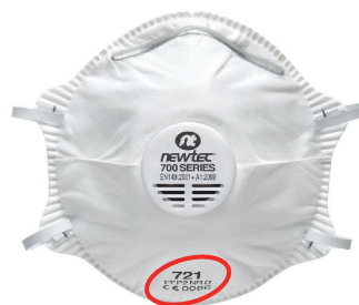
Slika 9 – Respirator za čestice klase 2 (FFP2), koji se ne može ponovno upotrebljavati nakon smjene (NR). Metalna štipaljka za nos omogućuje podešavanje respiratora prema licu, a ventil za izdah olakšava upotrebu.

Također je važno da OZO bude prikladan za upotrebu. Zato treba obratiti pozornost i na karakteristike pojedinca (nosi li naočale, ima li bradu, ima li ožiljke i sl.). Preporuka je da se zaštita ne drži na glavi nikada dulje od jednog sata u kontinuitetu. Ako se to pokaže potrebnim, bolje je primijeniti zaštitu s vanjskim dovodom zraka. Maske su teške i neugodne za nošenje. Ukupna masa filtra kod maske za cijelo lice ne smije prijeći 500 g.