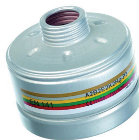
Slika 7 – Kombinirani filter. Vidljive oznake i boje za vrstu kemikalije i kapacitet. A2B2E2K2Hg-P3.

Na filtru stoji i oznaka "NR" – ograničena upotreba u jednoj smjeni ili "R" – može se ponovno upotrijebiti. Na filtru ponekad piše i dozvoljen broj sati za uporabu. Na slici 8 čestični je filter koji se može ponovno upotrebljavati, a na slici 9 je jednokratni respirator.