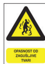
Slika 2b – Znak za opasnost od zagušljive tvari

U STL kemikalije u poglavlju 8.2.2, Osobna zaštita, navode se vrste OZO-a za zaštitu dišnih putova. Npr. za nitro-razrjeđivač : U slučaju prekoračenja graničnih vrijednosti tvari ili jedne od tvari proizvoda, upotrebljavati maske tipa AX Zaštitna maska (HRN EN 14387 4 ). U slučaju prisustva plinova, pare ili pare sa česticama upotrebljavati kombinirani filter. U slučaju da se radi o bezmirisnoj tvari ili da je njezin prag mirisa viši od odnosnog stupnja GVI i u slučaju izvanrednog stanja, staviti samostalni uređaj za disanje s otvorenim krugom sa stlačenim zrakom (HRN EN 137) ili cijevni uređaj za disanje (HRN EN 138). Radi točnog odabira zaštitnog uređaja dišnih putova vidjeti propis HRN EN 529. 5