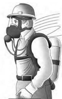
Slika 5 – OZO koji nije ovisan o okolnom zraku. Namijenjena za upotrebu kada je koncentracija kisika u zraku ispod 17 % ili pri visokim koncentracijama onečišćenja koje ne mogu savladati uređaji na bazi filtracije te u slučaju kada ne postoji odgovarajući filtari.