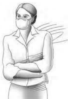
Slika 4 – Filtar namijenjen isključivo za zaštitu od kemikalija u obliku čestica i služi za jednokratnu upotrebu. Poznat nam je pod nazivom respirator.