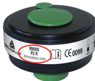
Slika 8 – Filter za čestice klase 3 (P3), koji se može ponovno upotrebljavati (R)