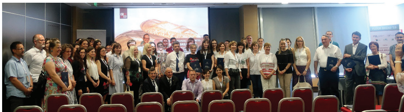
Slika 6 – Skupna slika sudionika preostalih na zatvaranju Kongresa

I na kraju, što reći svima Vama čitateljima koje smo zainteresirali da pročitate ovaj članak do kraja: slobodno nam pišite, komentirajte i predložite ideje kako bismo dodatno znanstveno i stručno obogatili nadolazeći kongres "Brašno-Kruh '21", a sve u svrhu da ga učinimo osebujnijim i još boljim, pri tome vodeći se nedvojbenim motom našeg Fakulteta koji glasi "Znanost u funkciji industrije".