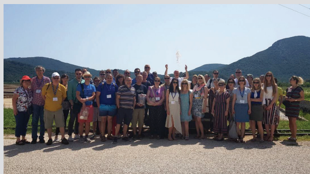
Slika 2 – Sudionici skupa Adriatic NMR na izletu u solanu Mali Ston