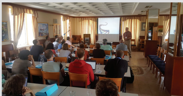
Slika 3 – Plenarno predavanje profesora Janeza Plaveca iz Ljubljane pod naslovom G-rich DNA Repeats and Their Intriguing 3D NMR Structures