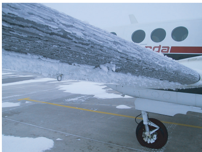
Slika 1 – Nakupine leda na tzv. napadnoj ivici (engl. leading edge ) krila zrakoplova (izvor:

Fenomen zaleđivanja može se ponajprije razmotriti sa stajališta energije površine, odnosno kako je potrebno umanjiti energiju