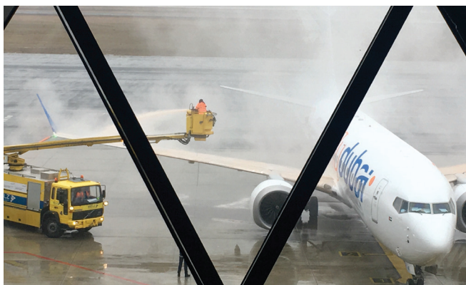
Slika 2 – Odležavanje zrakoplova u Međunarodnoj zračnoj luci Zagreb

UHMWPE). Najčešće uklopljene kapljevine u SLIP-u su ulja. Pripremljena površina pokazala je dobru mehaničku otpornost na abraziju, pri čemu je morfologija površine neznatno promijenjena, a zadržana su hidrofobna svojstva.