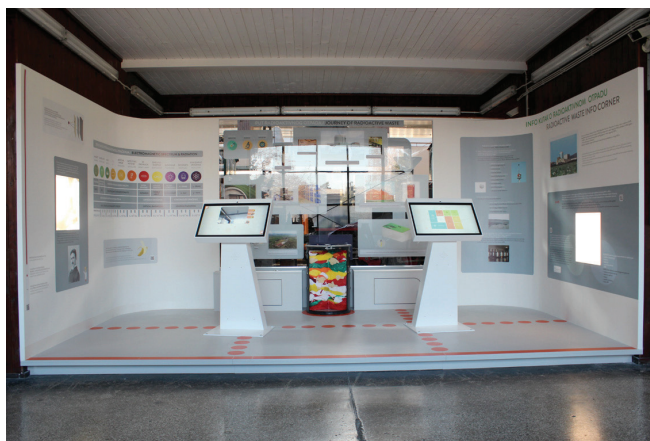
Slika 1 – "Info kutak o radioaktivnom otpadu", dio stalnog postava u Tehničkom muzeju Nikola Tesla 2

Specifičnost hrvatskog programa gospodarenja RAO-om svakako je u tome što, iako na neki način traje još od 1979. godine, 1 nikada nije uključivao sustavni program informiranja/educiranja/uključivanja javnosti. Premda je objavljen niz publikacija na tu temu, do nedavno se nije ozbiljno prišlo tom problemu. Tako je u posljednjih nekoliko godina poduzet niz inicijativa s ciljem informiranja javnosti, od kojih treba izdvojiti "Info kutak o radioaktivnom otpadu", novi dio stalnog postava u Tehničkom muzeju Nikola Tesla (slika 1).