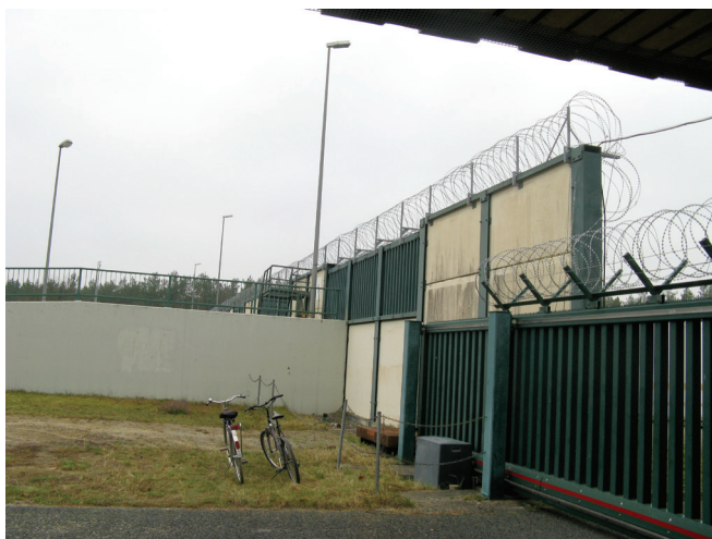
Slika 2 – Ograda oko skladišta ING-a u Njemačkoj

sno izlaganja radionuklidima, podrazumijevaju i iznimno visoku razinu fizičkog osiguranja, s obzirom na to da spadaju u objekte posebnog značenja i namjene. Na slici 2 prikazan je detalj ograde (jedne od dvije sukcesivne) postavljene oko skladišta ING-a u Njemačkoj.